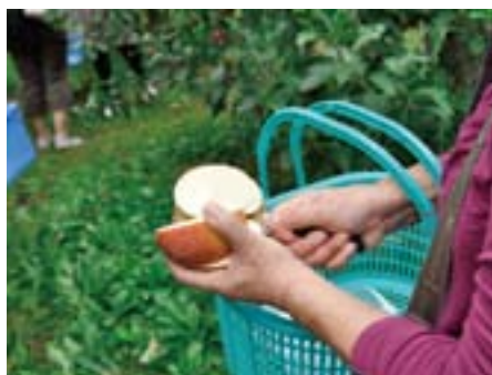
その場でサクッと。なかから りんごの蜜があふれ出す

JR牛久駅から車で約20分 圏央道阿見東ICから約5分 入園料：りんご狩り・大人500円、 3歳～小学生200円 持ち帰り1キロ400円 入園時間：りんご狩り・10時～16時30分 ブルーベリー摘み・9時～17時 休園日：金曜日 駐車場：20台 牛久市島田町1726 ☎029(875)0592 http://www.geocities.jp/naganumaringo/