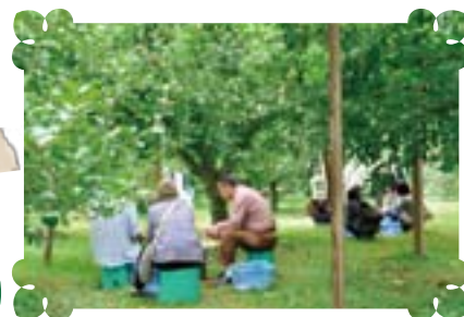
あちらこちらで「いただきます！」