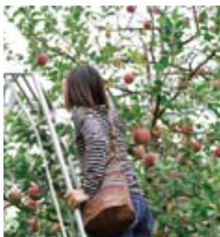
はしごを使って、高いところに 実るりんごの収穫にも挑戦！