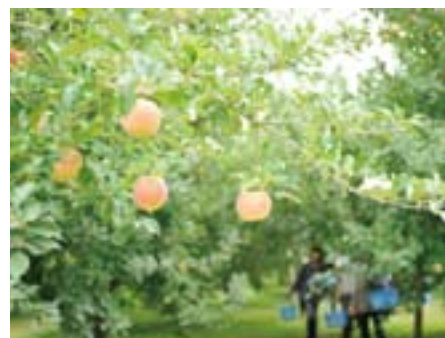
太陽の光をサンサンと浴びて 真っ赤に実ったりんごたち