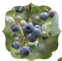
夏はブルーベリー 冬はヤーコンも 味わえる

秋はりんご狩り、夏はブルーベリー摘みや桃・ヤーコンが楽しめる観光農園。栽培方法にこだわり、皮ごと食べても安心・安全な果物をつくるために、完熟堆肥や有機肥料を使い、できる限り減農薬で育てています。これらの農法が認められ、平成15年にはエコファーマーの認定も受けました。 牛久産で、大切に育てられた「かつぱりんご」。園内に20種類以上のりんごが植えられており、9～11月末まで常時3～5種類のりんご狩りが楽しめるようになっています。いずれの品種も太陽の光を浴びて真っ赤になった実から、自然な香りと甘さがあふれてきます。 6～8月に楽しめるブルーベリー摘みも、大粒なものばかり。無農薬で育てたブルーベリーは、摘み取ったその場で食べても大丈夫。風味豊かな香りと甘さが口いっぱいに広がります。 ※果物狩り期間は変更される場合があります。HP等でご確認ください。