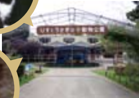
りすとうさぎの小動物公園