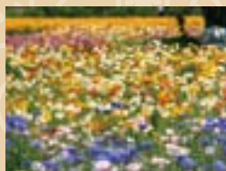
春はポピー、秋はコスモスなど、お花摘みができます