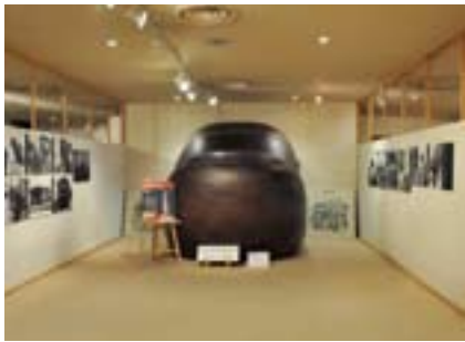
こんなに大きい！大仏様の足の親指