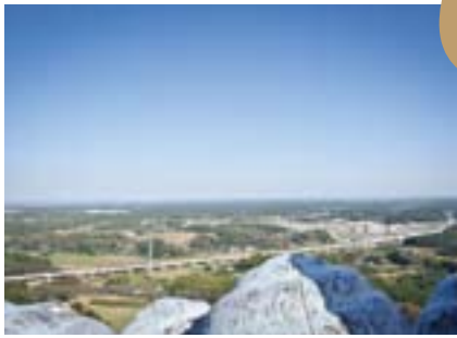
大仏様の頭にある螺髪(らほつ)は直径1m、重量200kg、総数480個