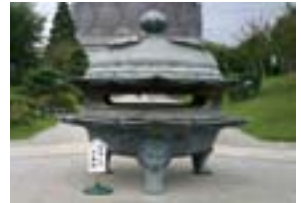
日本一の巨大香炉