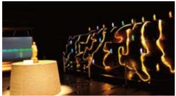
光の世界の大仏様