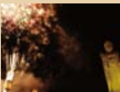
8/15万燈会や12/31修正会、花火を打ち上げ