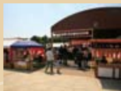
5月のGWには「なつかし露店と大道芸人」を開催！